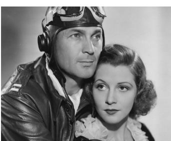
1938 LE RAYON DU DIABLE (Flight to Flame) de Charles C. Coleman avec Julie Bishop