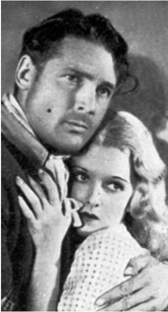
1932 FILLE FAROUCHE (Wild Girl) de Raoul Walsh avec Joan Bennett