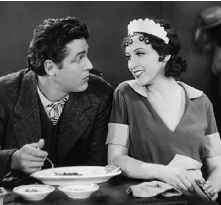
1928 L'INTRUSE ou LA BRU (City Girl) de Friedrich Wilhelm Murnau avec Mary Duncan