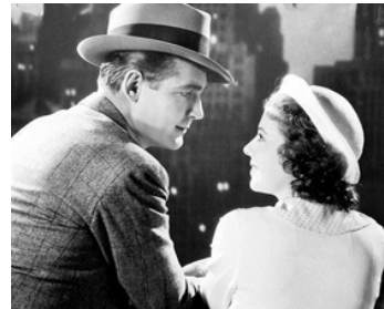
1934 PREMIER AMOUR (Change of Heart) de John G. Blystone avec Janet Gaynor