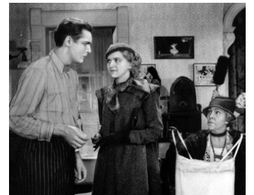
1933 AGGIE APPLEBY MAKER OF MEN de Mark Sandrich avec Wynne Gibson