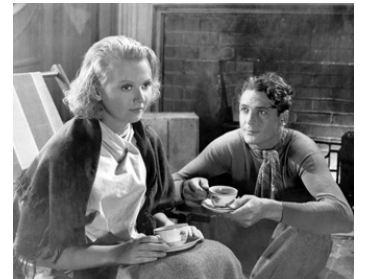
1935 PARADIS INTERDIT (Forbidden Heaven) de Reginald Barker avec Charlotte Henry