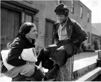
1926 VAINCRE OU MOURIR (The Old Ironsides) de James Cruze avec Wallace Beery