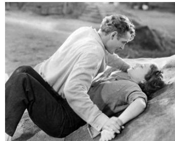
1932 TESS AU PAYS DES TEMPÊTES (Tess of the Storm Country) d'Alfred Santell avec J. Gaynor