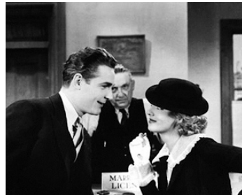
1933 THE BIG SHAKEDOWN de John Francis Dillon avec Bette Davis