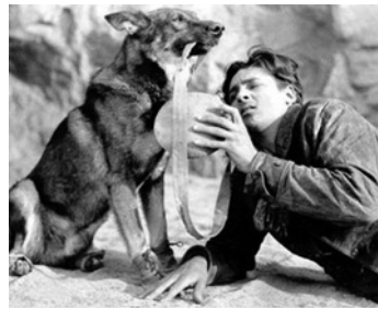
1925 L'APPEL DES LOUPS (Clash of the Wolves) de Noel M. Smith avec Rin-tin-tin