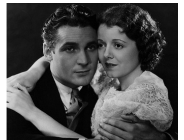
1930 SUNNYSIDE UP de David Butler avec Janet Gaynor