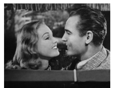
1941 JEU MORTEL (The Deadly Game) de Phil Rosen avec June Lang