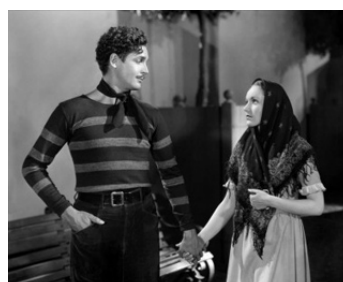
1930 LILIOM (Liliom) de Frank Borzage avec Rose Hobart