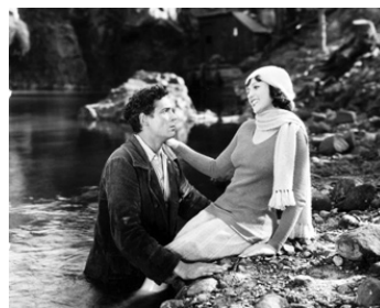
1929 LA FEMME AU CORBEAU (The River) de Frank Borzage avec Mary Duncan