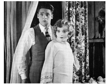
1926 SANDY (Sandy) de Harry Beaumont avec Madge Bellamy