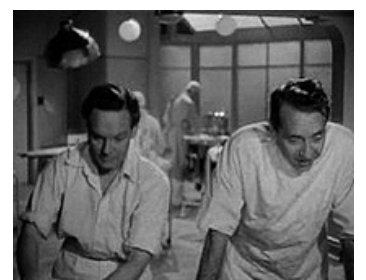
1937 BOMBES SUR LONDRES (Midnight Menace) de Sinclair Hill avec Fritz Korner