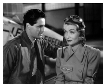
1940 DESCENTE EN VRILLE (Tail Spin) de Roy del Ruth avec Constance Bennett