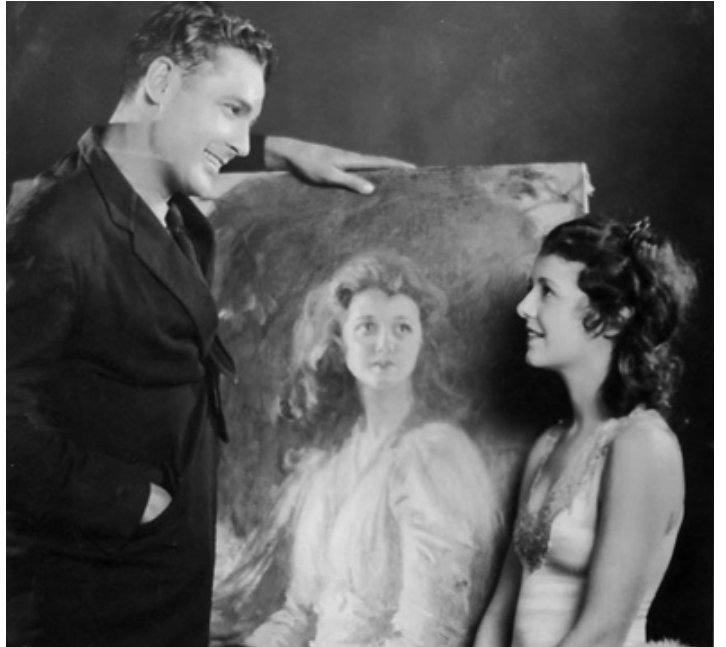
1928 L'ANGE DE LA RUE (Street Angel) de Frank Borzage avec Janet Gaynor