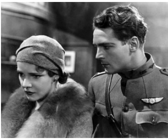
1931 BODY AND SOUL d'Alfred Santell avec Elissa Landi