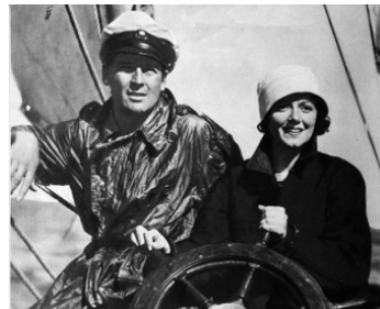
1932 THE FIRST YEAR de William K. Howard avec Janet Gaynor