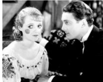
1931 DÉLICIEUSE (Delicious) de David Butler avec Janet Gaynor