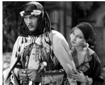
1928 L'INSOUMISE (Fazil) d'Howard Hawks avec Greta Nissen