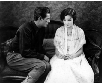
1927 THE ROUGH RIDERS de Victor Fleming avec Mary Astor