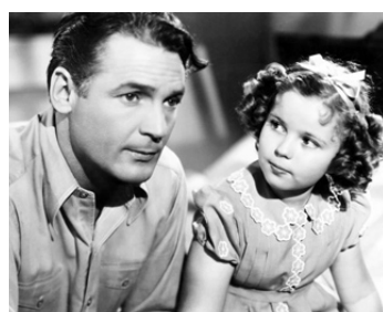
1938 LA VIE EN ROSE (Just around the Corner) d'Irving Cummings avec Shirley Temple