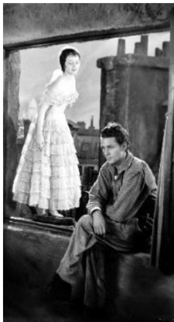
1927 L'HEURE SUPRÊME (The Seventh Heaven) de Frank Borzage avec Janet Gaynor