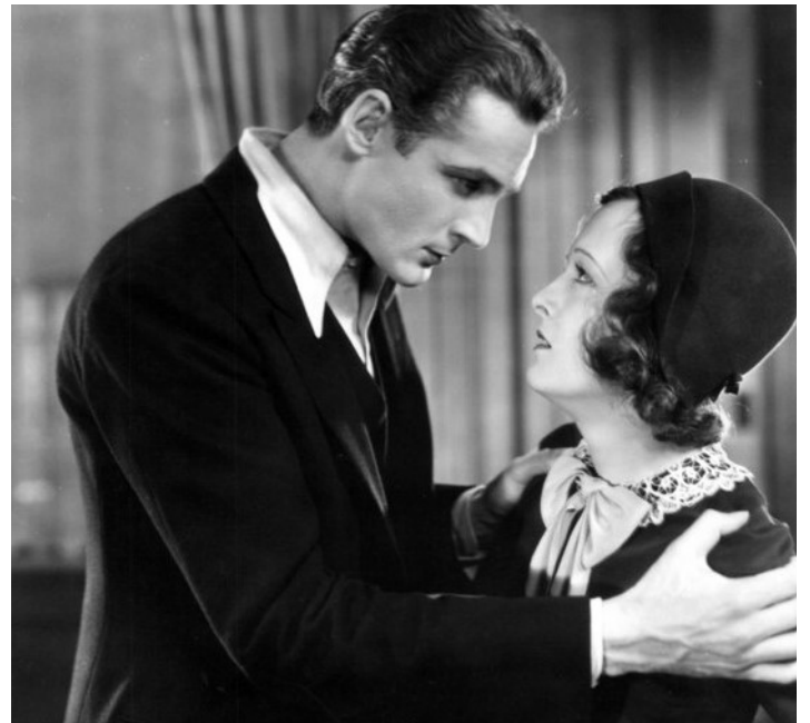
1932 AFTER TOMORROW de Frank Borzage avec Marian Nixon