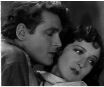
1923 ROSITA (Rosita) d'Ernst Lubitsch avec Mary Pickford