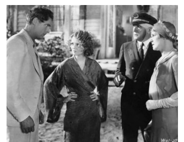
1931 HORS DU GOUFFRE (The Man who came back) de Raoul Walsh avec Janet Gaynor