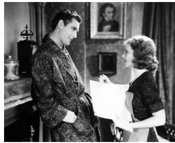
1931 LA PETITE ANNE-MARIE (Merely Mary Ann) de Henry King avec Janet Gaynor