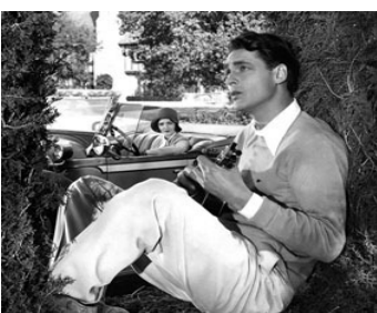
1930 HIGH SOCIETY BLUES de David Butler avec Janet Gaynor