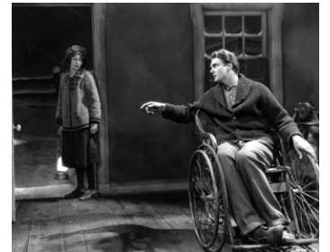
1929 L'ISOLÉ (Lucky Star) de Frank Borzage avec Janet Gaynor